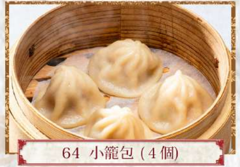
64 小籠包 (4個)