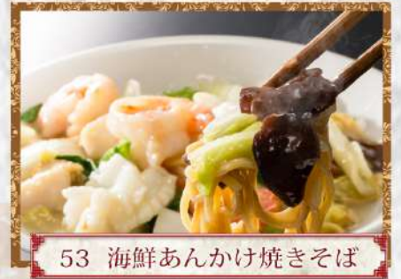
53 海鮮あんかけ焼きそば