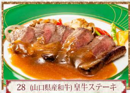
28 (山口県産和牛) 皇牛ステーキ