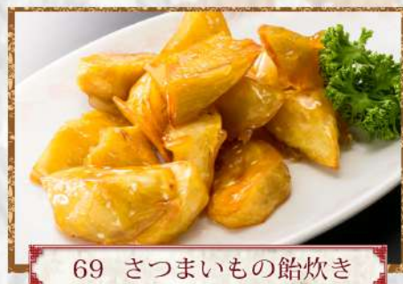
69 さつまいもの飴炊き