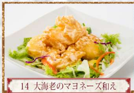
14 大海老のマヨネーズ和え