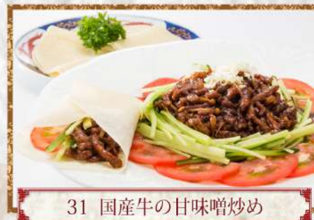
31 国産牛の甘味噌炒め

27 国産牛サーロインステーキ 完熟牡蠣のオイスターソース…… 3,000円 Stir-fried beef sirloin steak milky oyster sauce