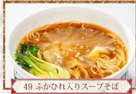
49 ふかひれ入りスープそば