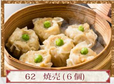
62 烧売 (6個)