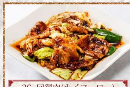
36 回鍋肉(ホイコーロー)