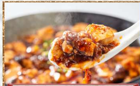
37 皇牛入り麻婆豆腐