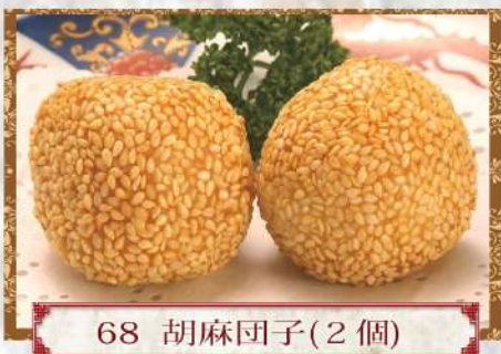
68 胡麻団子 (2個)