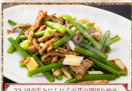
32 国産牛とにんにくの芽の細切り炒め

36 ホイコーロー 回鍋肉 …………… 小 1,700円 中 2,600円 Stir-fried pork and cabbage with spicy miso