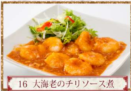
16 大海老のチリソース煮