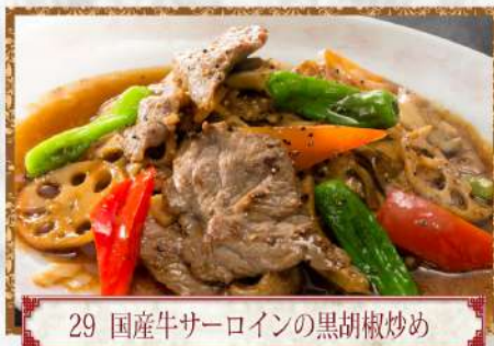
29 国産牛サーロインの黒胡椒炒め