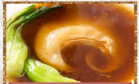
10 ふかひれの姿煮込み

1 冷菜三種盛り合わせ..... 小 3,000円 中 4,500円 Assorted cold platter (3 items) ※仕入れ状況により内容が変わります