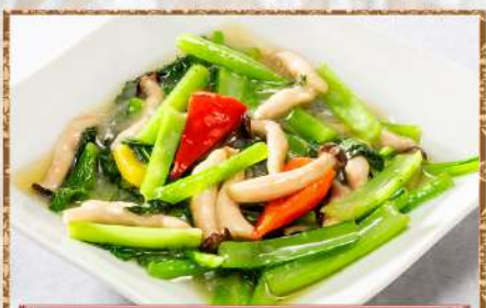
40 青菜のあっさり炒め

46 酸辣湯 / ..... 1人前 700円 小 1,400円 中 2,100円 Sour and pepper soup Szechwan style