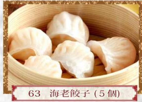
63 海老餃子 (5個)