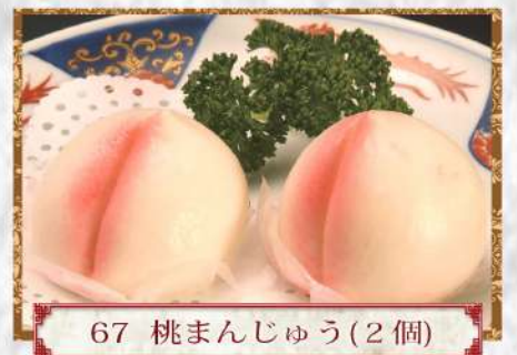
67 桃まんじゅう (2個)